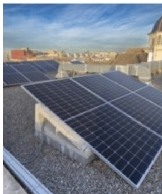
Comunitats energètiques locals a Albalat i Alcàsser