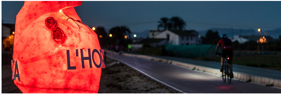
El Cor de l'Horta obra d'art efímera a Almàssera

Hi ha paratges naturals, autèntiques joies paisatgístiques, que han sigut modelades per la naturalesa durant milions d'anys. Però hi ha unes altres on l'autoria li la devem a la mà de l'home. Generacions d'agricultors que han sabut conservar fins als nostres dies un espai únic que conta la història, en primera persona, de la cultura valenciana. València és hui l'única ciutat del món que té la sort de gaudir d'un espai agrícola periurbà. Milers d'hectàrees, repartides en xicotetes explotacions, dedicades al cultiu d'hortalisses i cítrics. Horts connectats per camins i senderes per a recórrer, desconnectar de la ciutat i connectar amb la terra.