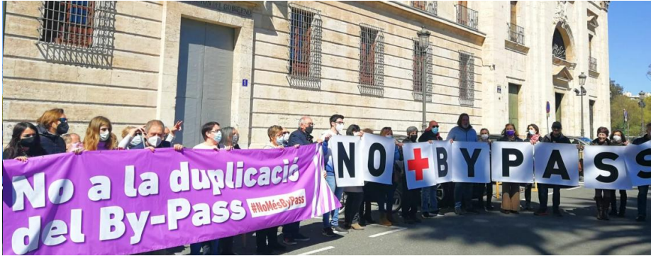
El Bypass al passat. No a la duplicació del By-Pass