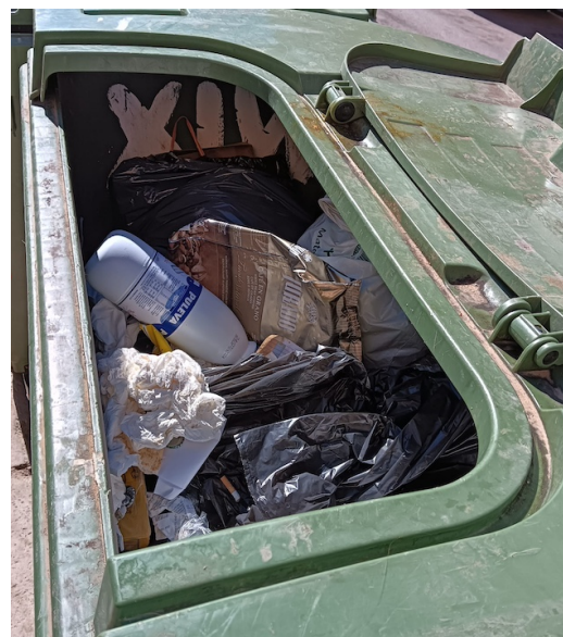
Cal una recollida selectiva més eficient