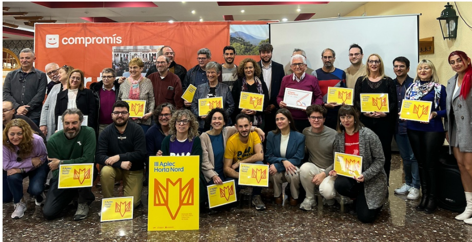
Merescut reconeixement al III Aplec de l'Horta Nord

Els llauradors i les llauradores valencianes estan mobilitzant-se arreu de tot el nostre territori, així com també ho fan milers i milers d'agricultors per tota Europa. La seua consigna és clara: la gran majoria no poden viure del treball que fan al camp. L'encariment dels costos de producció i la climatologia adversa, principalment en forma de sequeres, han agreujat les dificultats ja de per sí complexes del que suposa mantindre el model tradicional agrari, i que no han estat compensades suficientment en el cas de haver estat perceptors d'ajudes del Ministeri d'Agricultura ni tots els sectors se n'han pogut beneficiar per falta d'una línia d'ajuda específica. La liberalització del mercat agrari mitjançant els Acords Comercials simplement no funciona en el sector agrari europeu, tot el contrari. Suposen facilitar l'entrada de productes agraris de tercers països sense els mateixos estàndards de producció i burocràtics que se'ls exigeix a les produccions europees. Tot per facilitar la venda d'altres productes europeus com ara tecnològics, automobilístics, etc. a